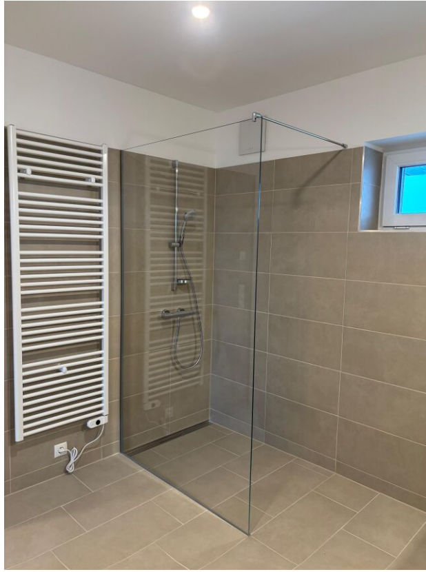
Innenansicht eines Badezimmers