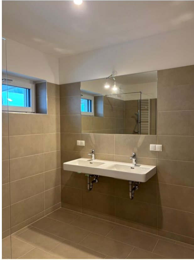
Innenansicht eines Badezimmers